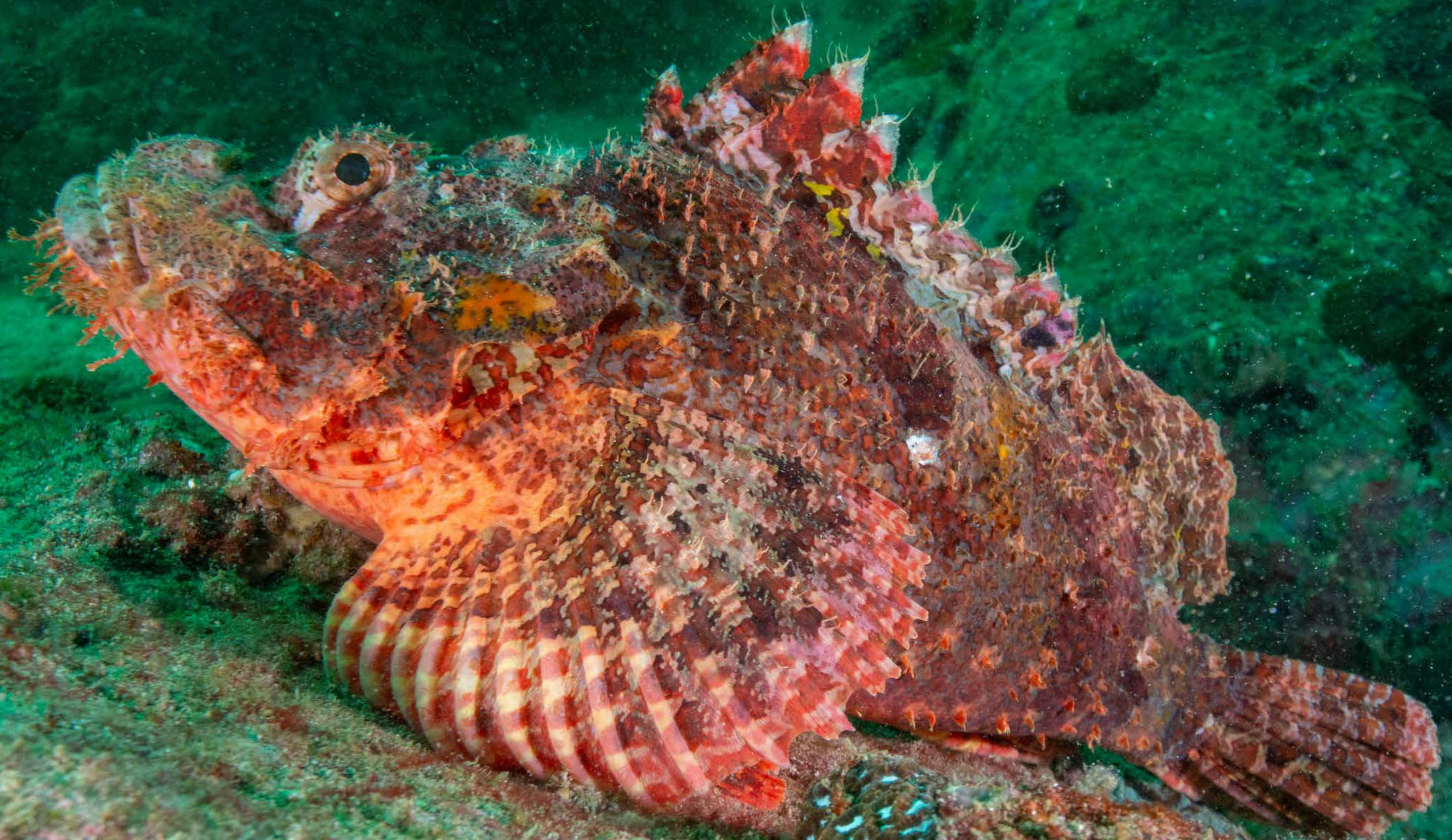
FRYNSET DRAGEHOVEDFISK Scorpaenopsis oxycephala